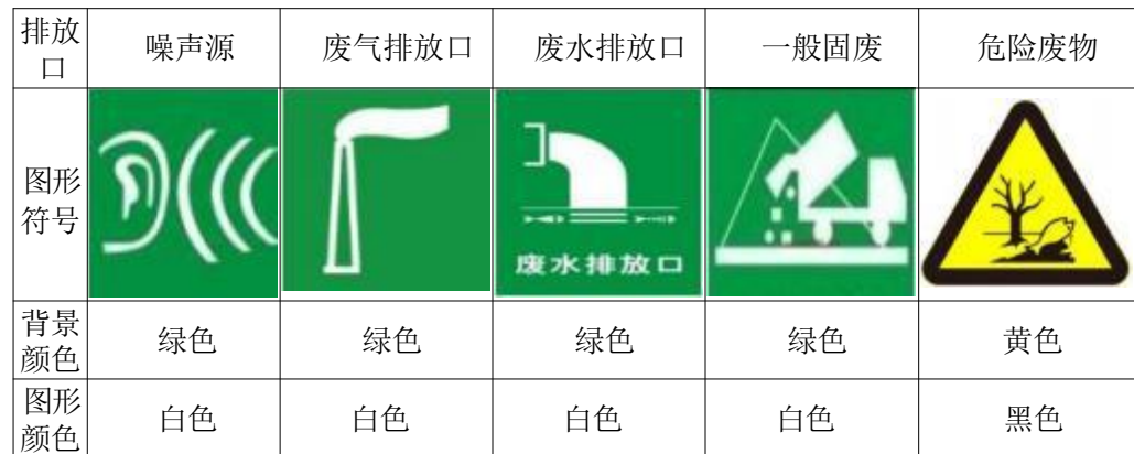
表 5-1 环境保护标志一览表

根据原国家环境保护总局《关于开展排放口规范化整治工作的通知》《环境保护图形标志-排放口（源）》和本项目污染物排放的实际情况，项目所有排放口（包括水、气、声、渣）按照“便于采样、便于计量监测、便于日常现场监督检查”的原则和规范化要求，设置与之相适应的环境保护图形标志牌，排污口的规范化要符合环境监察部门的相关要求。在各排污口设立相应的环境保护图形标志牌，排放口图形标志见表 5-1。