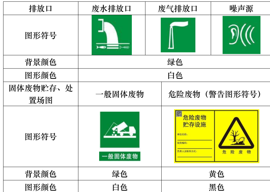
表 5-1 各排污口（源）提示标志牌示意图

响报告表应当报行政审批局重新审核。 5.项目建成之后，建设单位应及时编制突发环境事件应急预案，并报送生态环境主管部门及时完成备案。 6.排污口规范化 本项目应根据《环境保护图形标志》（15562.1-1995）、《排污口规范化整治技术要求（试行）》（环监〔1996〕470号）、《危险废物识别标志设置技术规范》（HJ1276-2022）等规范设置排污口并规范管理。各排污口（源）提示标志牌如下表 5-1。